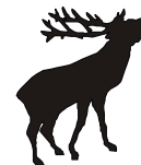
Таблица №111 (L-7) №112 (L-7-1)

Популация на Благороден елен ЛР на ЛД от ЛС"Сокол-2001"гр.Антоново допустим запас 178 бр.